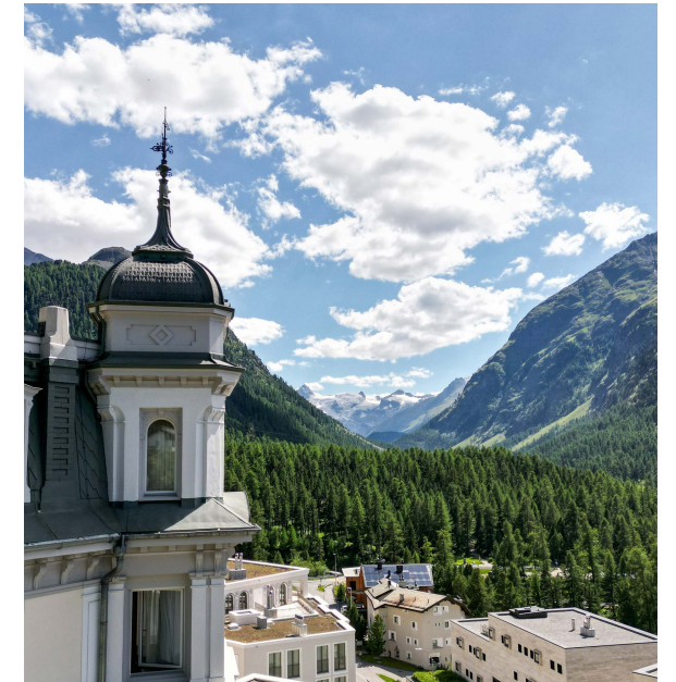
Hotel mit Ausblick