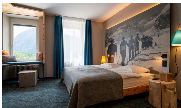
Beispiel Doppelzimmer Arve Comfort (20-27 m 2 )